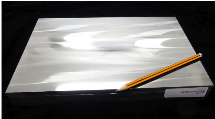
Homogene galvanische Nickelphosphor-Abscheidung mit 8 mm Schichtstärke, vorgefräst und bereit zur nanometergenauen Strukturierung